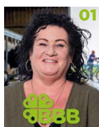
Caroline van der Plas